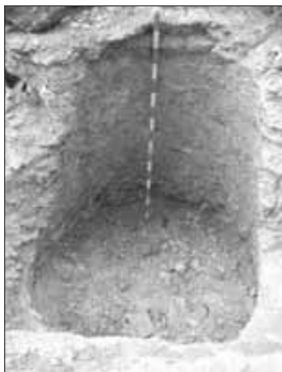
Vista general del final dels treballs

constatar que la paret de la sitja-pou va ser seccionada durant els treballs de rebaix amb màquina, però per sota de la cota de l'obra, era fàcilment resseguible