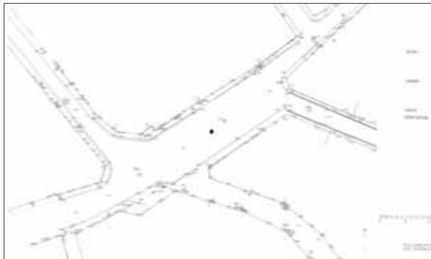
Plànol de les obres. El punt negre situa la sitja excavada