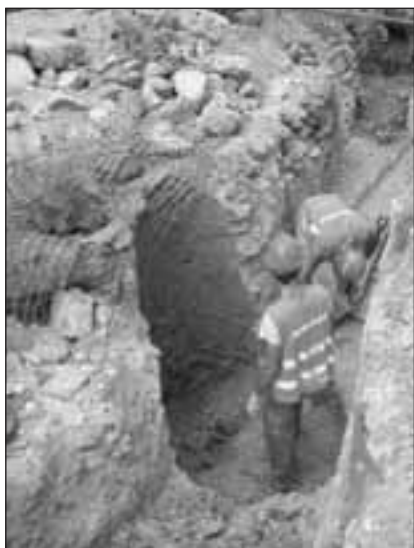
Vistes generals i detalls del procés d'excavació

constatar que la paret de la sitja-pou va ser seccionada durant els treballs de rebaix amb màquina, però per sota de la cota de l'obra, era fàcilment resseguible