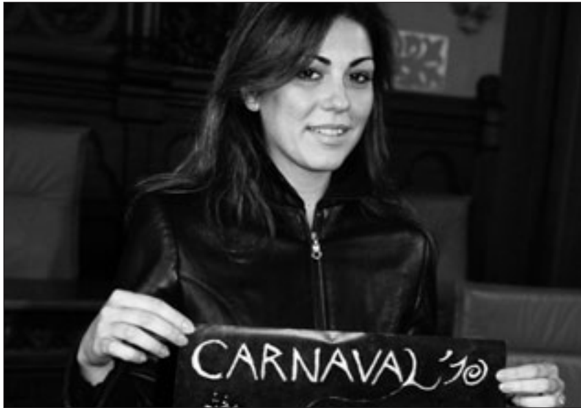
Blanca Benítez és l'autora de la imatge del Carnaval

Un ampli dispositiu de seguretat estarà format per més de 300 efectius de Mossos d'Esquadra, Policia Local, Bombers, SEM i Creu Roja.