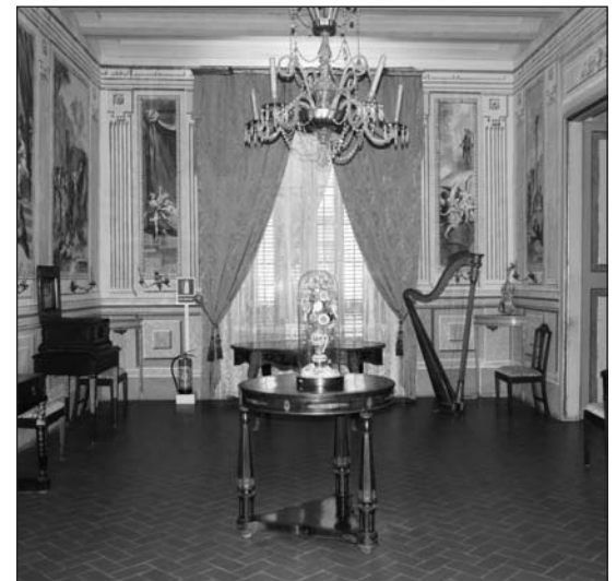
El Museu Romàntic augmentarà l'activitat

Un dels principals objectius del nou pla d'actuacions és evitar les generacions absents. Això vol dir que des del Consorci es treballarà per tal que els escolars visitin, com a mínim, en dues ocasions, etapa d'infantil i de secundària, els museus de Sitges. Paral·lelament les actuacions del Consorci del Patrimoni es basaran també en fer