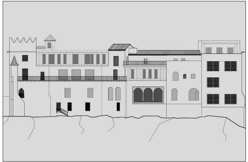
La reforma de 2011 planteja recuperar la imatge del 1918