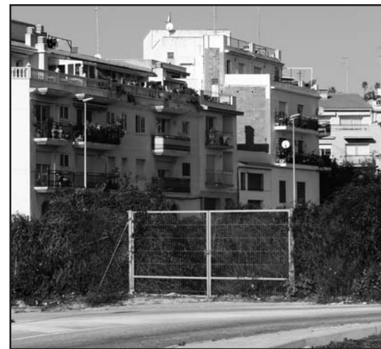
El nou planejament pretén afavorir les iniciatives econòmiques i millorar la mobilitat

El Pla Parcial és una eina que detalla les previsions fetes en el Pla d'Ordenació Urbanística Municipal (POUM) aprovat al 2005.